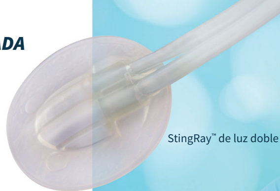
StingRay™ de luz doble

Nuestros kits de vendajes de la serie avanzada proporcionan un cuidado insuperable, principalmente debido a nuestra campana de aspiración de luz doble StingRay, con patente pendiente. La StingRay posibilita que nuestros kits avanzados midan la presión en el lugar de la herida, a diferencia de otros productos, que miden la presión a una distancia de hasta 85 cm o más. En resumen, puede estar seguro de que la presión que usted fija en la unidad de control es exactamente la que existe en el lugar de la herida. (Vea el gráfico siguiente).