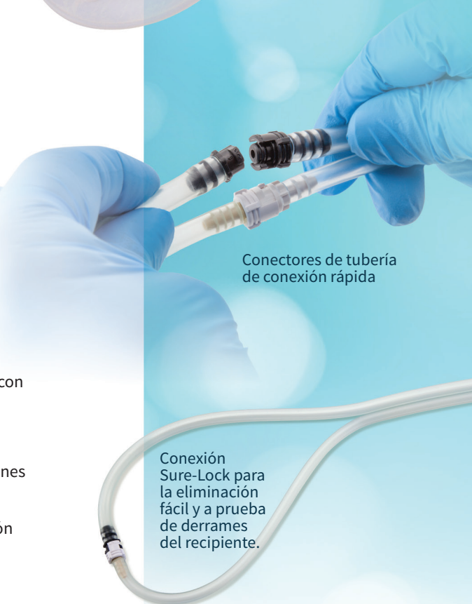
Conectores de tubería de conexión rápida