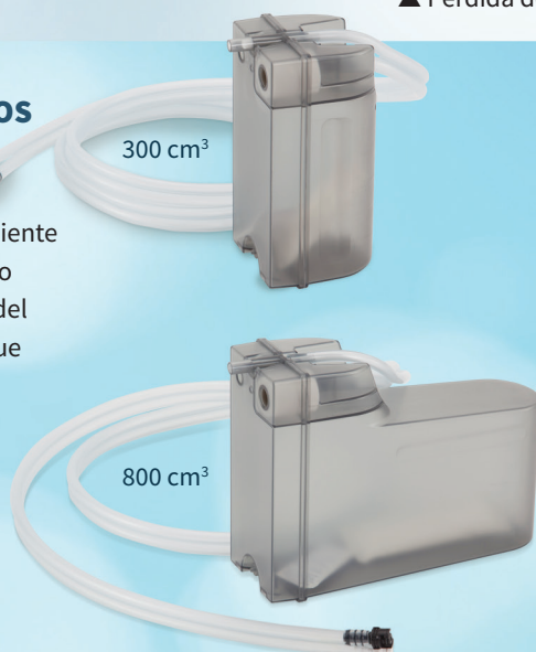
Recipientes de serie avanzada con conectores Sure-Lock

El sistema WoundPro puede pedirse con un recipiente de recolección de 300 cm 3 o de 800 cm 3 , dependiendo del paciente y del ámbito en que se atiende la herida. Con ambos tamaños de recipiente incluimos un agente desodorante y un gelificante. El paquete de gel elimina prácticamente la probabilidad de que haya salpicaduras durante el cambio de recipientes.