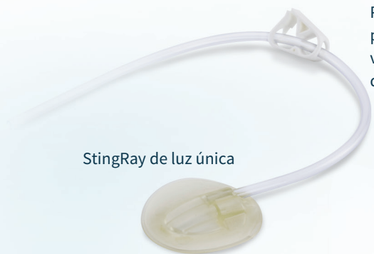
Pinza de tubería para cambios de vendaje a prueba de derrames