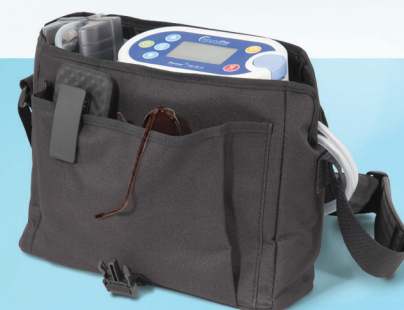
Amplio bolsillo para artículos personales.

Cada unidad de control WoundPro viene con un bolso para transporte liviano y de mucha utilidad. El bolso permite que los pacientes con movilidad disfruten de libertad de movimientos y puede usarse colgado en una silla de ruedas. Gracias a una útil abertura en la parte de atrás, también pueden cargarse las baterías de la unidad de control mientras está en el bolso.