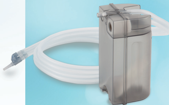
Recipiente de la serie básica